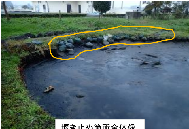
堰き止め箇所全体像