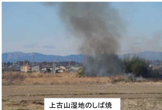
上古山湿地のしば焼