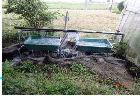
飼育槽南側の状態