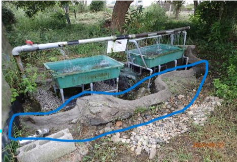
飼育槽北側堤防(高さ≒15cm)