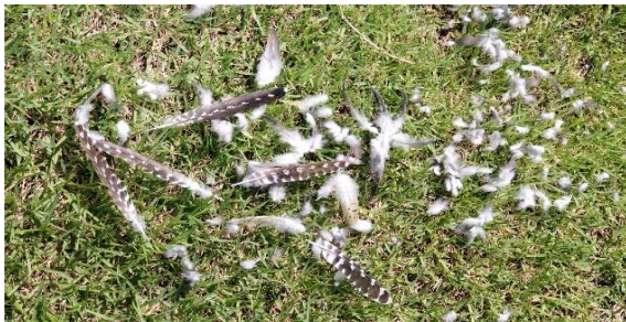
蔓巻公園管理棟の南側に野鳥の 羽根が散乱(猛禽の仕業?)