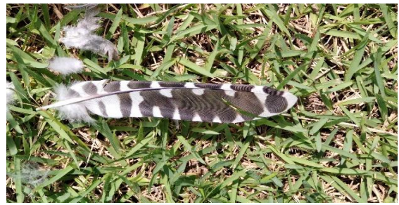
この羽根の正体は？ ツツドリ※の赤色形だそうです

※ツツドリとは「ホトトギス・カッコウなどと同じく托卵をする仲間」で姿かたちも大変良く似ています。その中の赤色形なので、全体的に茶褐色が掛っています。・・・因みに我が探鳥会での生きた観察事例はありません