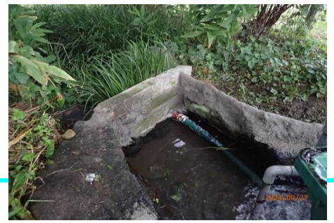
水路上流の壁 (新開発のシリタルが大活躍)