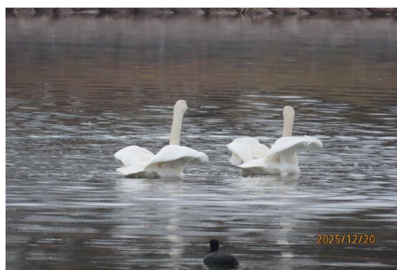
オオハクチョウ2羽 他幼鳥4羽